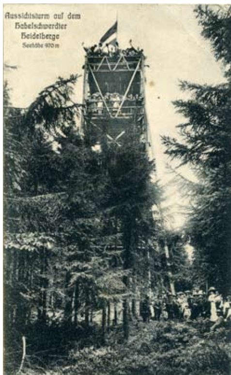
Fig. 2. Jagodna I – Otwarcie wieży widokowej na Jagodnej.