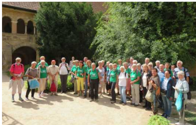
Bei der Kulturwanderung am 7.8. durch Hildesheim mit den 35 Wanderfreunden der Wanderbewegung Magdeburg e.V. waren wir auch am 1000-jährigen Rosenstock im Hildesheimer Dom.