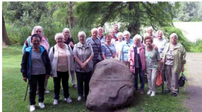
Unsere Wanderer und „Fußkranken“ waren gemeinsam am 4.8. im Schul- und Bürgergarten am Dowesee spazieren.