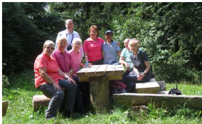
Am 1. und 15. August haben wir mit zwei Gästen vom RGV gemeinsam die Wildemanner Wandernadel erwandert.