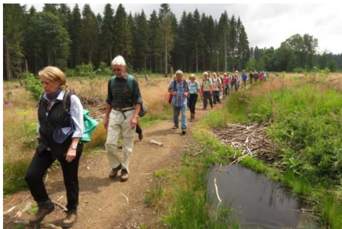
Über eine abgeholzte Fläche ging der Pfad im Gänsemarsch.

Dieser Bericht wurde auch im „Wanderer im RGV“ abgedruckt.