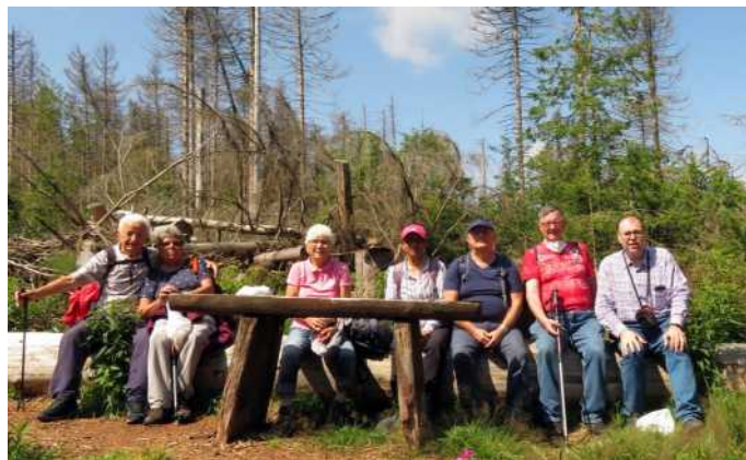
Sonderstempel der Harzer Wandernadel sammelten wir am 18.7. auf dem WaldWandelWeg und im Kellwassertal bei Torfhaus.

Dieser Bericht wurde auch im „Wanderer im RGV“ abgedruckt.